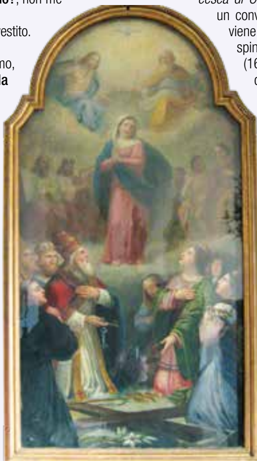
Madonna in gloria tra Santi, olio su tela