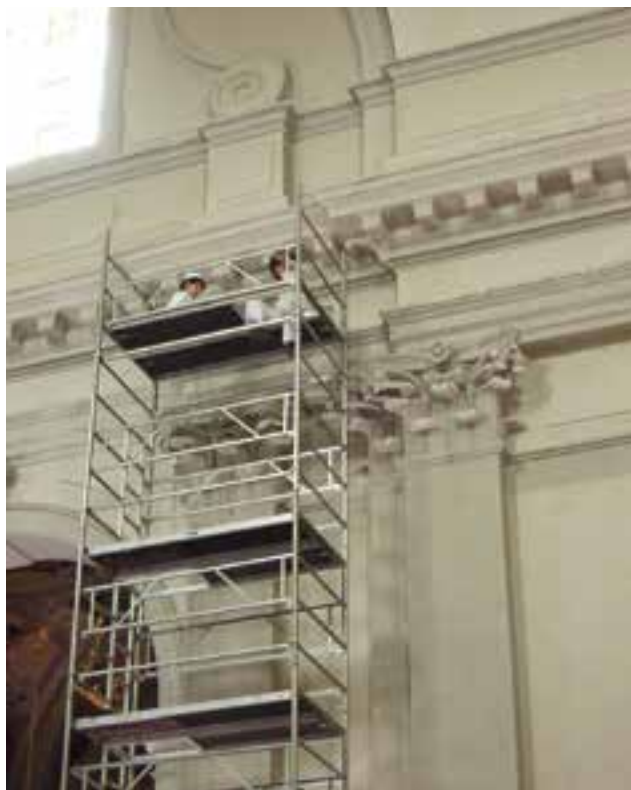
Prelievo di campioni di intonaco e di pitture

Per chiudere, un appello. Come esposto, oltre alle erogazioni regionali, la parrocchia deve fare la sua parte sia assumendo a suo carico almeno il 20% della spesa prevista per il progetto - vale a dire circa 50.000 euro -, sia accollandosi direttamente i costi di alcune opere accessorie che si stanno prospettando come necessarie per la buona salute degli intonaci interni (finesstrature apribili, sistemazione dell'impianto di riscaldamento) e, quale massima aspirazione, dell'intervento sulla facciata. C'è quindi ampio spazio per la dedizione e la generosità dei tricesimani, cui, a tutti indistintamente, dovrebbe stare a cuore un bene così rappresentativo e qualificante per la nostra cittadina.