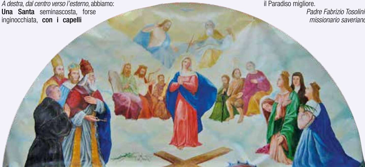
Madonna in gloria tra Santi, olio su tela realizzato da Padre Fabrizio Tosolini, 2008