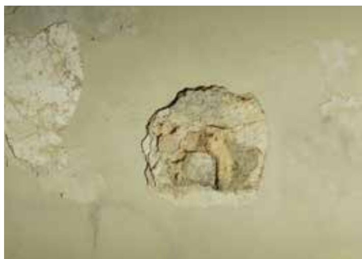
Esempi di degrado nella chiesa parrocchiale