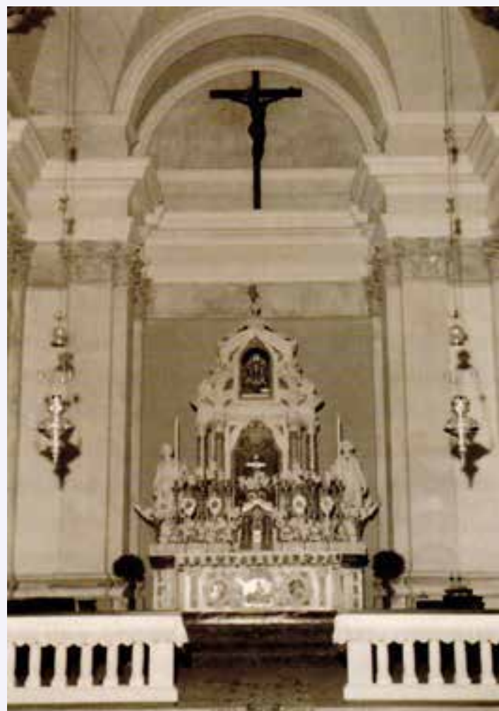
Il presbiterio negli anni '50

Al centro in alto, il Padre, il Figlio e lo Spirito Santo manifestano il loro compiacimento per Maria , la quale appare non come incoronata, ma in atteggiamento di preghiera, contemplazione, ringrazia-