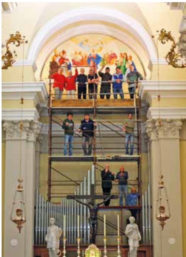
Tutti per la foto ricordo a fine opera