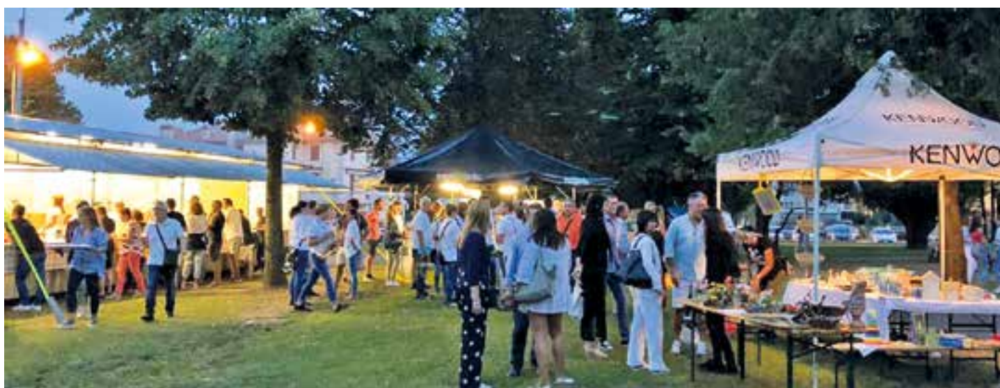
Momenti della sagra di Santa Filomena 2019